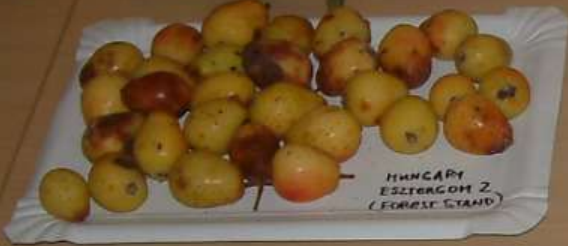
HUNGARY ESZTERGOM 2 (FOREST STAND)