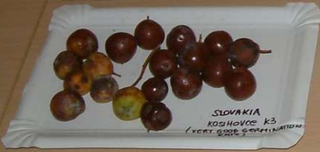
SLOVAKIA KOSHOVCE K3 (VERY GOOD GERMINATION RATE)