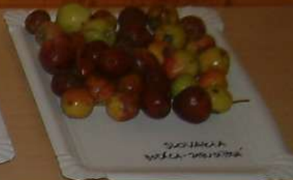
SLOVAKIA BOŠÁČA - ZABUDÍŤOVÁ