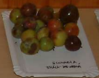
SLOVAKIA BOŠÁČA - ZABUDÍŤOVÁ