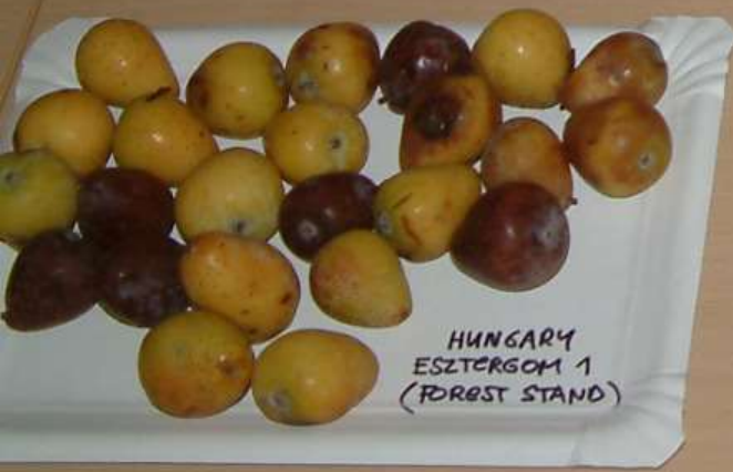
HUNGARY ESZTERGOM 1 (FOREST STAND)