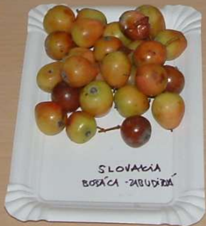
SLOVAKIA BOŠÁČA - ZABUDÍŤOVÁ