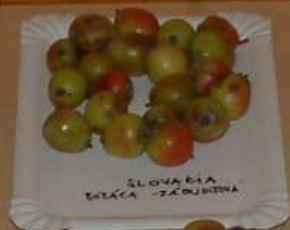
SLOVAKIA BOŠÁČA - ZABUDÍŤOVÁ