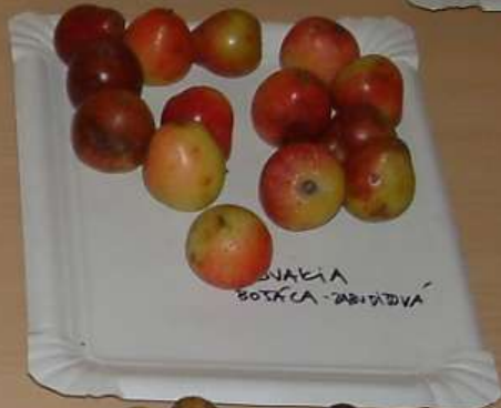
SLOVAKIA BOŠÁČA - ZABUDÍŤOVÁ