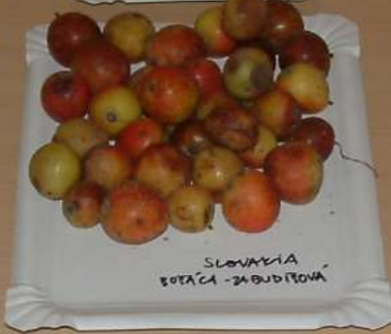
SLOVAKIA BOŠÁČA - ZABUDÍŤOVÁ