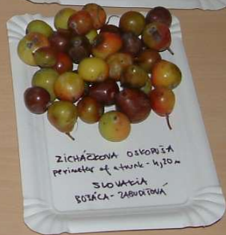
ZICHÁČKOVÁ OSKORUŠA Perimeter of a trunk - 4,20 m SLOVAKIA BOŠÁČA - ZABUDÍŤOVÁ